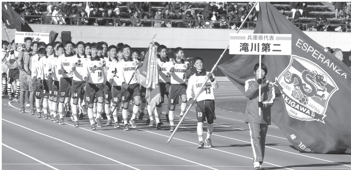
最高の舞台、「幸」せっぱいの笑顔で入場行進