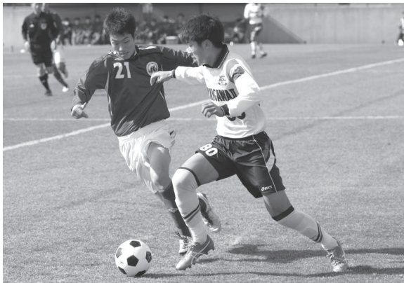
ゴールへ向ってドリブル突破!!