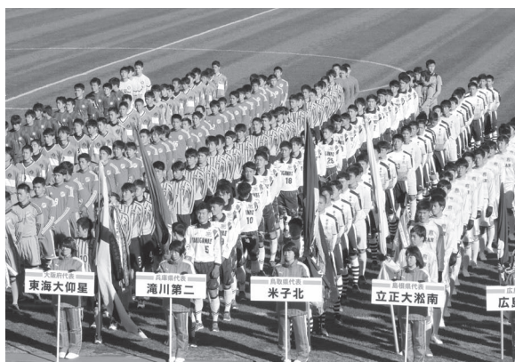
夢の舞台「全国選手権大会」