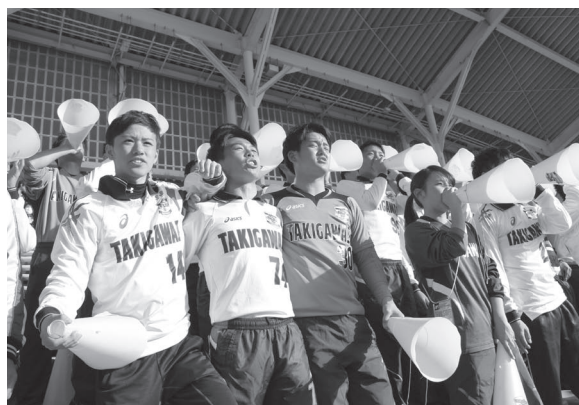
俺たちがついてる!