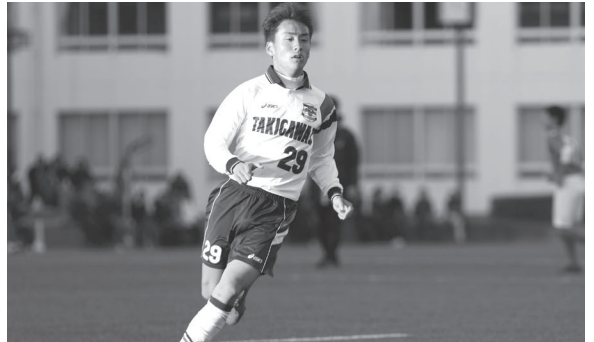
「全国」の舞台を目指し戦う「滝二」の戦士達!