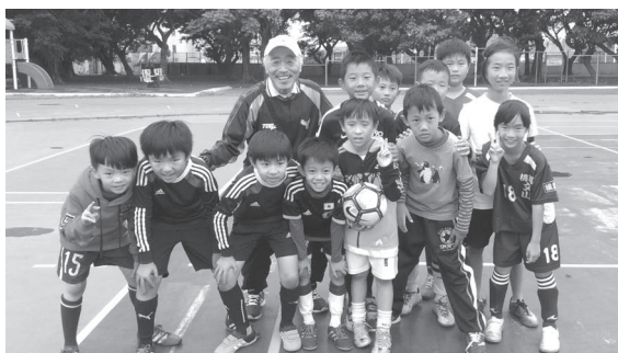
いつも子供達と一緒にだよ(2016年11月)

そのうち守るべき家族を持つでしょう。そのあたりから人生は面白くなってきますね。いやいやサッカーで面白いのは終了10分前だよ。その通り。そこまで人生を楽しみましょう。“怯まず、驕らず、澁刺と”