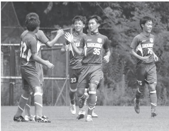
次こそ「プリンス昇格」頼むぞ!!

来年の県リーグでも苦しい試合は必ずあると思う。そういうときこそチームでまとまって必ずプリンスリーグへ昇格してほしい。