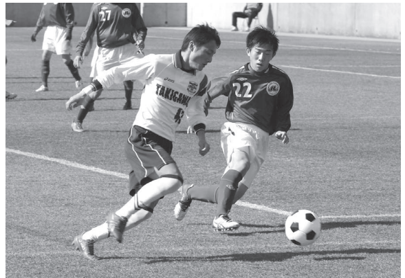
ドリブルでサイドを切り裂く!