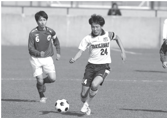
頼むぞ! 「新キャプテン」

新人戦を通して決定力不足という課題も出たので改善していきたい。サッカー以外の部分からもう一度見直して、インターハイ、選手権では滝二らしく戦いたい。