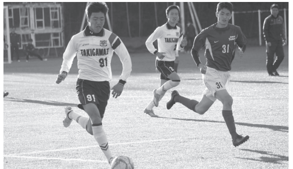
「次は俺たちの番だ!!」