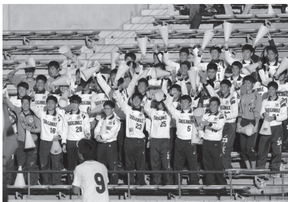
一丸となって応援!!