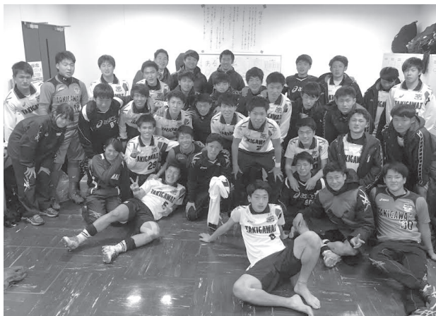
祝ベスト8！思い出のロッカールーム

僕達の失敗、経験が無駄にせず、常に上を目指して、必ず埼玉スタジアムで優勝して下さい！