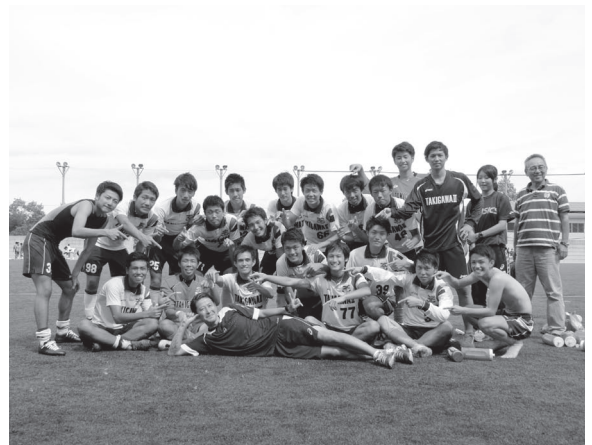
県リーグ2部「優勝」!! 最高の笑顔!!