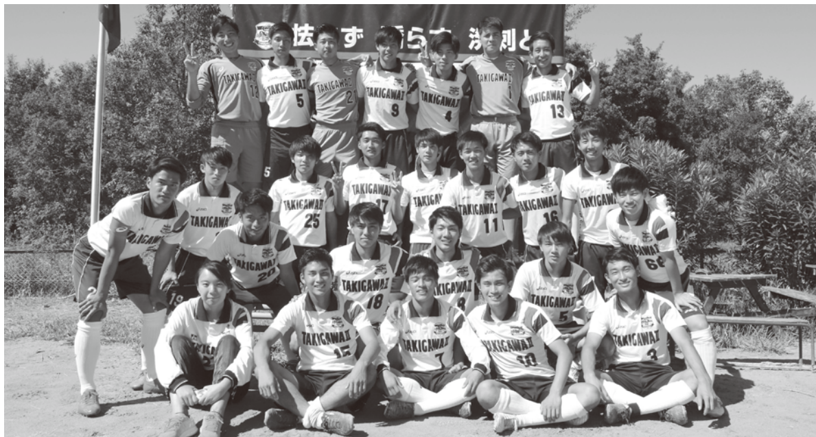
未来へはばたけ33回生