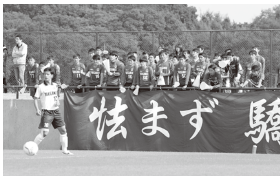
皆の思いを背負って