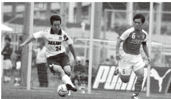
勝利に向かいドリブル突破!

負けが続く苦しいリーグ戦でした。降格という結果になってしまい差を痛感した1年間となってしまいました。自分達には苦しい時のチームのまとまりが足りず、その一体感の所で差が出たのではないかと思います。そして、リーグ戦での勢いの悪さのまま選手権に入って選手権でも負けてしまい、1年をかけて戦うリーグ戦からの勢いの大切さも学ぶことができました。来年の県リーグでも苦しい試合や苦しくなる時期は、必ずあると思います。そういうときこそチームでまとまり、またプリンスリーグに昇格してほしいと思います。また、1年間のリーグ戦を通して成長して選手権に良い勢いで望めるようにリーグ戦1試合1試合を無駄にしないように頑張してほしいと思いました。