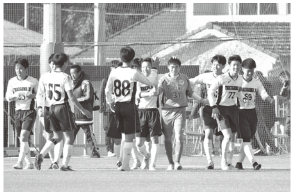
我らが守護神スーパーセーブ！「笑」への第一歩！