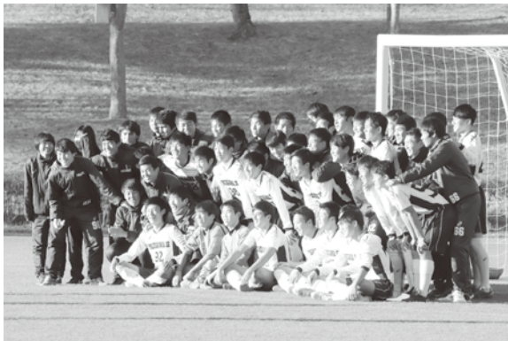
好敵手を打倒し新人戦神戸市予選優勝！

試合中に改善するとかそういう問題ではなく、自分達のミスから自分達で試合を壊した。全ては練習の詰めのみだと思ふ。この悔しさを忘れず、これから更に厳しさを持って練習をし、まずはインターハイ全国大会出場できるよう努力していきたい。