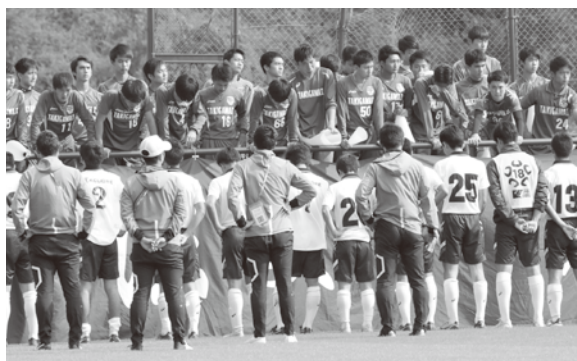
後一步届かなかった夢思いを託し