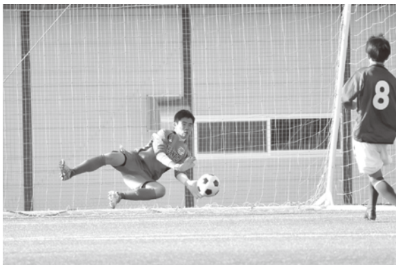
勝利を導くシュートストップ！