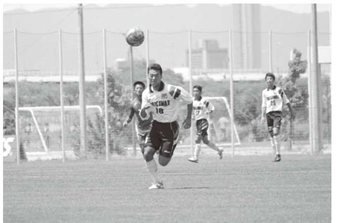
灼熱の中ゴールへ一直線

この大会を通しての課題は接戦の試合で競り負けるなど勝負弱いのが目立ちました。トーナメントとかを考えて接戦を勝てるチームになっていきたいと思います。