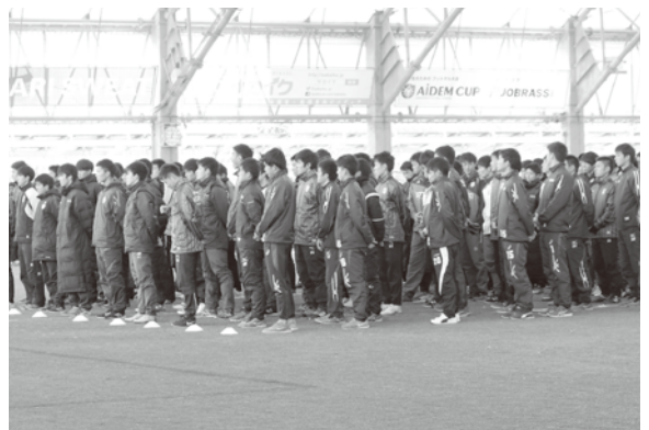
長きに渡ったプリンスリーグも閉幕へ