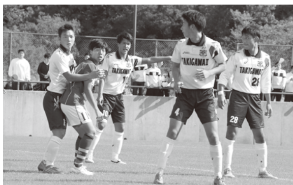
絶対にゴールは割らせない！

最後まで応援してくださった方々、本当にありがとうございました。また、引き続き応援のほどよろしくをお願いします。