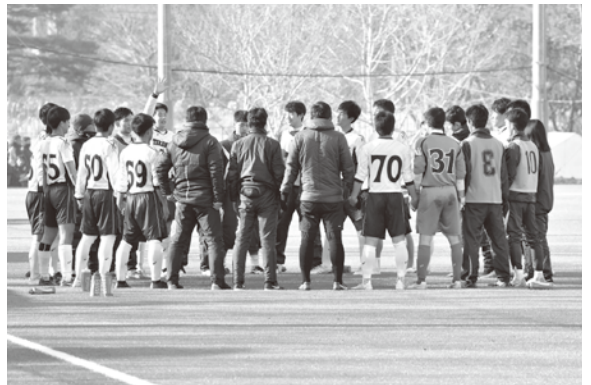
新主将！できる できる できる！