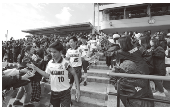
選手権に向けいざ出陣