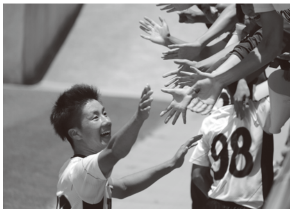
アスパ五色での3決勝利は選手たちの自信に