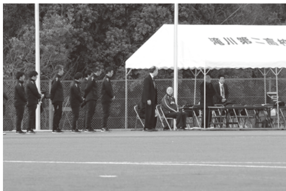
完成披露式典の様子