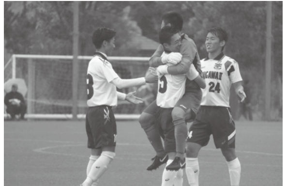
やったぞ!まずは1勝