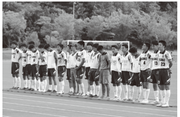
次のステージへ気持ちを一つに