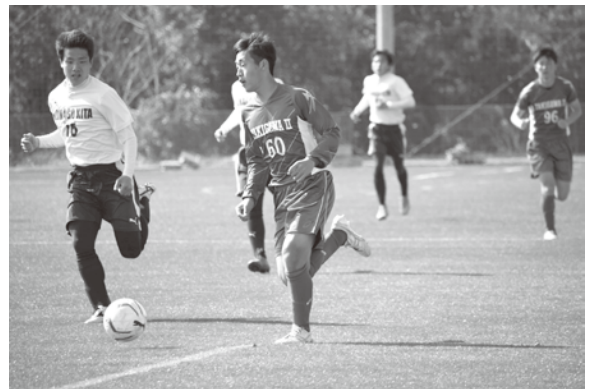
ドリブル突破 行けー！