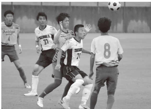
絶対先にボールを触る