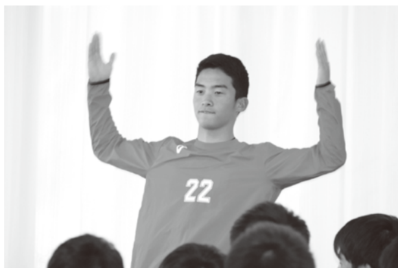
「見せたるわ!これが名物、滝二の一発芸じゃい!」

現在の自分は試合には出れないけど応援や会場運営等の裏方の仕事を一生懸命頑張りたいと思います。