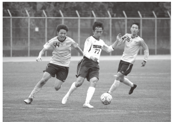
取れるものなら取ってみる