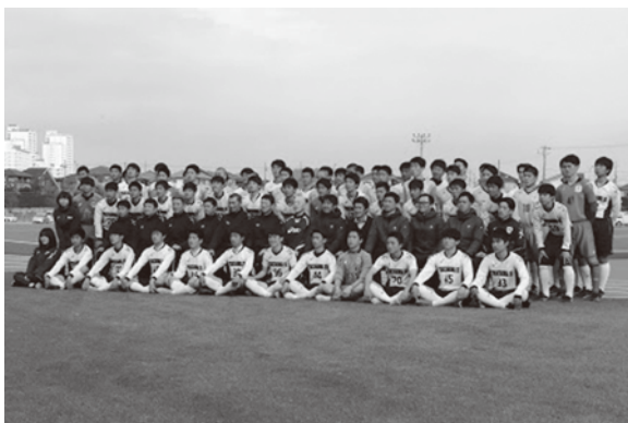
交流戦の様子はサンTVのニュースでも紹介されました